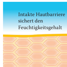
Intakte, schützende Hautbarriere mit Linolsäure-reichen Lipiden.

Dr. August Wolff GmbH & Co. KG Arzneimittel 33532 Bielefeld, GERMANY